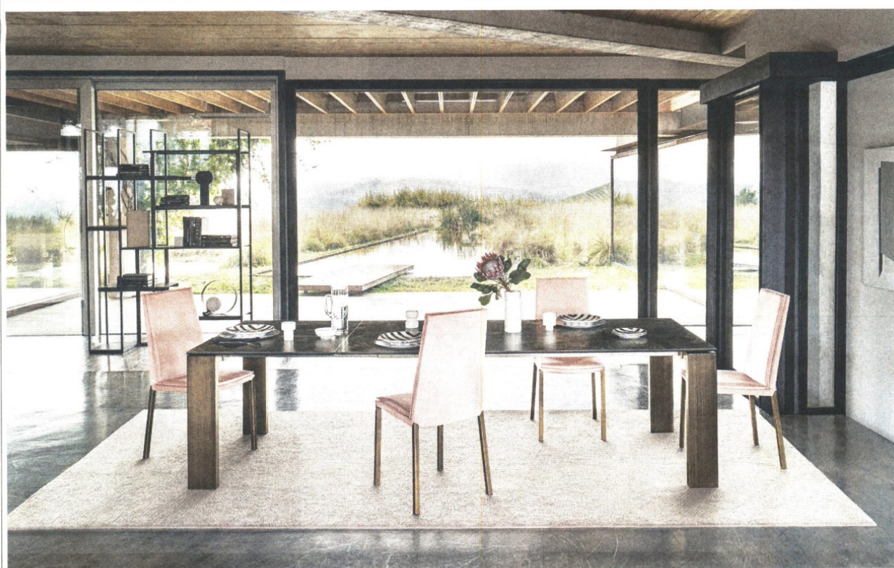
TAVOLO ATLANTIS SEDIE SVEVA LIBRERIA FREE-WALL

▲ Comodino light Piccoli sì, ma di carattere. Basti pensare all'evoluzione espressiva di cui i comodini sono protagonisti. Al classico contenitore di forma cubica con cassetti si affiancano soluzioni più originali, come l'ultimo arrivato nella famiglia Madame di Calligaris: leggero e illuminante. Lo studio Bernhardt & Vella pensa a una struttura con due ripiani che si può dotare di una luce a led per liberare lo spazio altrimenti occupato dall'abat-jour